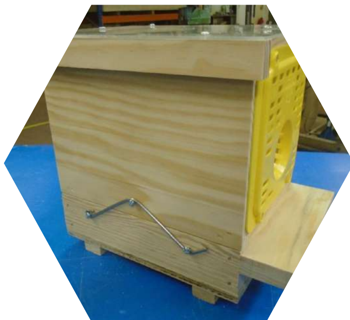
Piège nasse à grilles Néoppi jaunes

Renouveler l'appât au plus tous les 8-10 jours, en laissant quelques frelons vivants à l'intérieur du piège, les phéromones attirent les frelons et repousseraient les autres insectes.