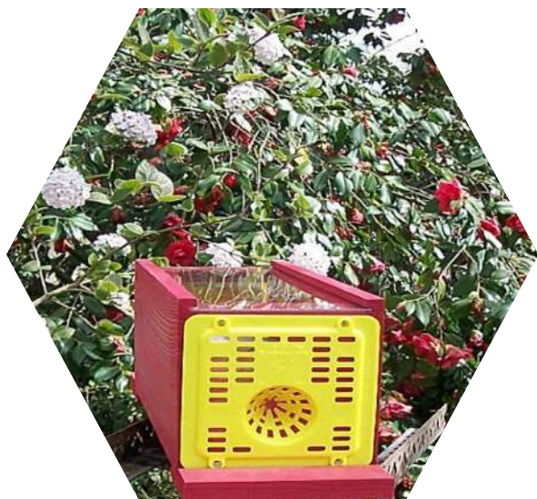
Piège chez un particulier