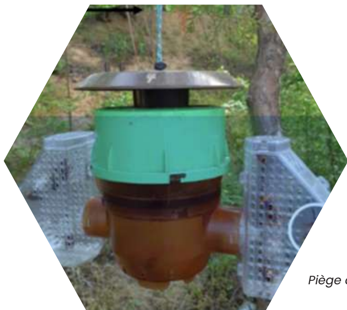
Piège coréen à ailes